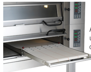
Absetzer für eine schnelle und effektive Beschickung des Ofens.